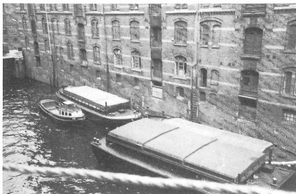
Abb. 1: Speicher am Fleet

Auch in diesem Jahre unternahmen wir eine Studienfahrt. Sie führte am 10.9.1989 nach Hamburg. Es wurde die Speicherstadt der Hansestadt besich-