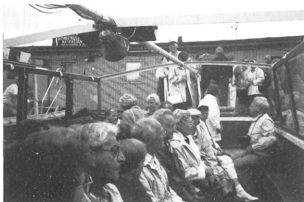
Abb. 2: Mit einer Barkasse in den Fleeten